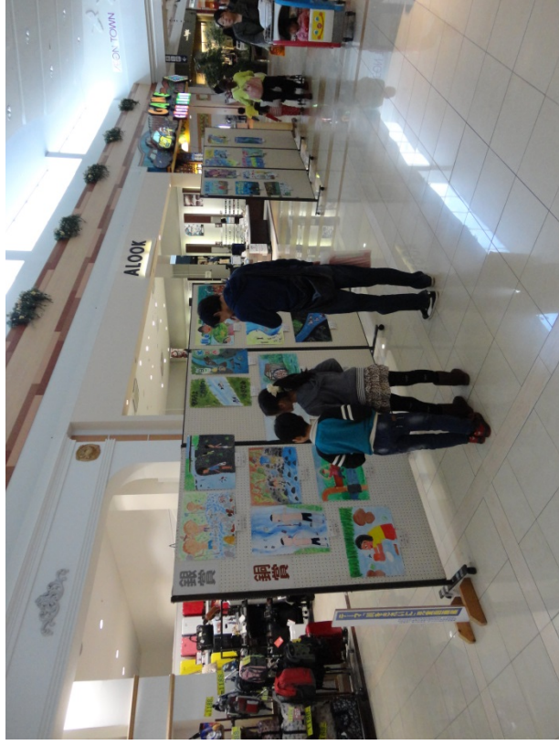
H27児童图画入选作品展示状況(イオンタウン佐沼店:H27.10.20~10.25)