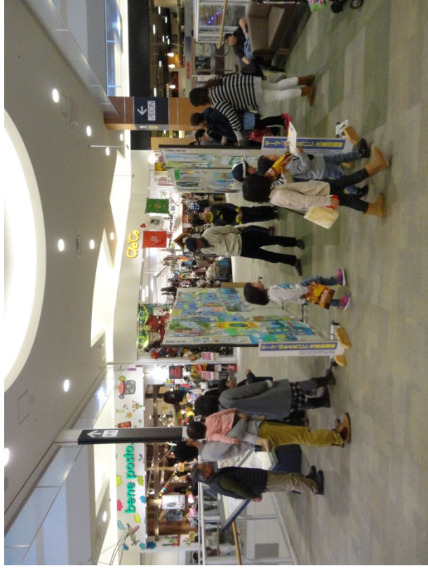
H27児童图画入选作品展示状況(イオンモール石巻店:H27.11.19~11.24)