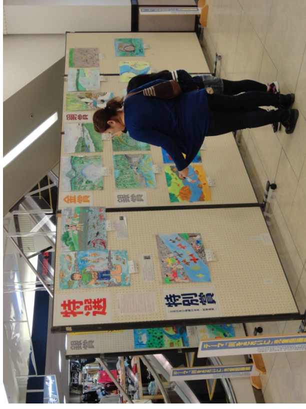
H27児童图画入选作品展示状況(イオン古川店:H27.10.27~11.1)