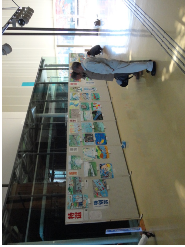
H27児童图画入选作品展示状況(遊学館:H27.11.4~11.10)