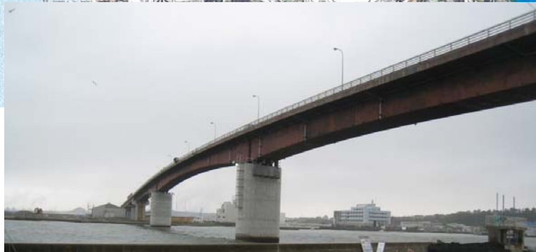
日和大橋 (旧北上川 石巻市魚町一丁目～雲雀野一丁目地先)