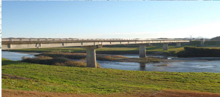
高倉橋 (鳴瀬川 大崎市古川中沢～三本木齊田地先)