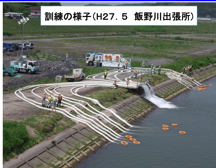
北上川下流河川事務所 排水ポンプ車配備状況