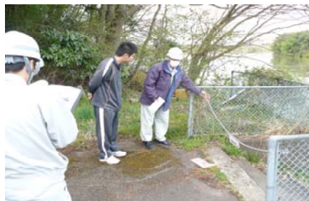
点検状況（北上川漕艇施設）