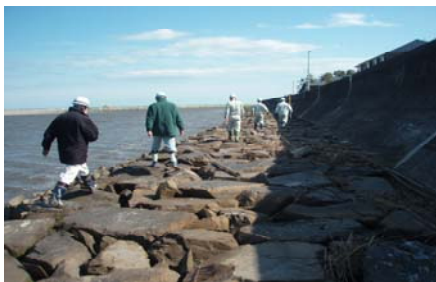
点検状況（鳴瀬川河口）