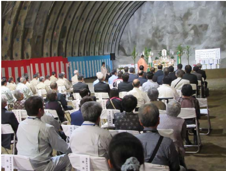
▲約80名が参列した式典の状況

6月5日(日)に盛岡市築川地内において、築川トンネルの安全祈願祭が実施されました。当日は工事関係者や地元の方々約80人が参列しました。式典では、復興庁岩手復興局長、盛岡市長等による「玉串奉奠」や、児童等と一緒に「鍬入之儀」を行い、被災地の1日も早い復興と工事の安全を祈願しました。式典の終わりには、盛岡市長の来賓挨拶等が行われました。これから築川トンネルは本格的な掘削工事に入ります。築川トンネルが本格着工したことにより、区界道路で計画されている全ての大型構造物が工事着手したこととなります。