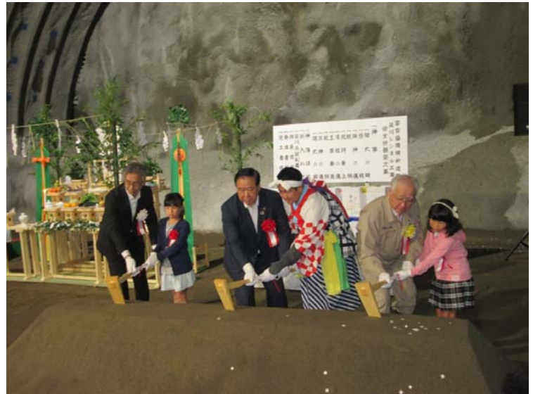
▲小学生・中学生も鍬入之儀に参加しました