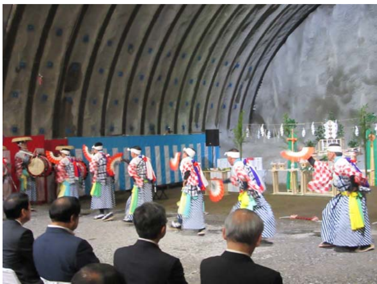
▲工事の無事を祈り、高鉦築川剣舞が奉納されました