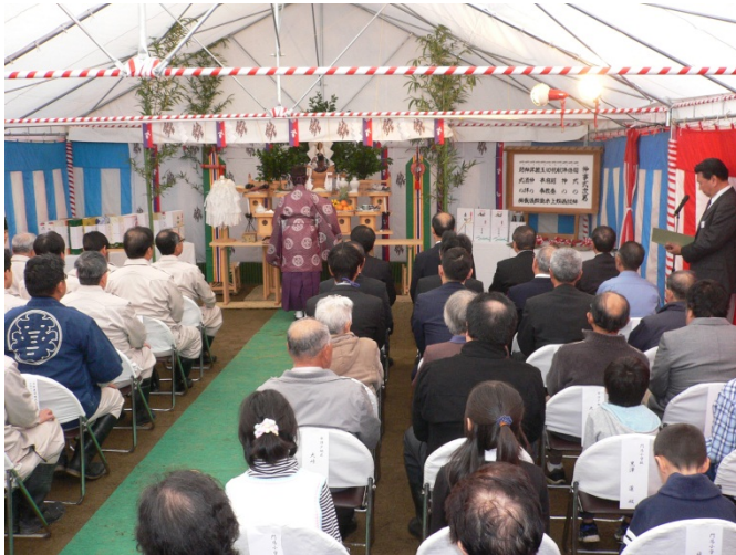
▲地元の方々や工事関係者およそ60人が参列しました。

10月24日（土）、宮古市平津戸地内において、平津戸トンネル工事の安全祈願祭が実施されました。当日は、地元の方々や工事関係者等、約60人が参列しました。式典では、復興庁岩手復興局長、宮古市長等による「玉串奉奠」や、地元の児童と一緒に「鍬入之儀」を行い、被災地の1日も早い復興と工事の安全を祈願しました。式典の終わりには、宮古市長の来賓挨拶等が行われました。これから平津戸トンネルは本格的な掘削工事に入ります。