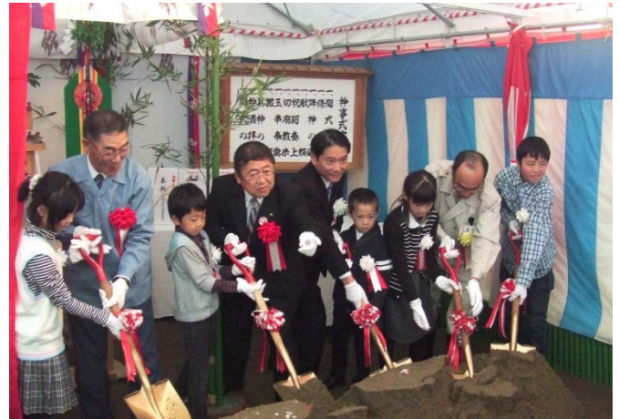
▲地元の児童も鍬入之儀に参加しました。