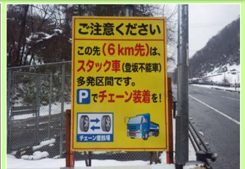
スタック多発区間注意喚起看板

二戸国道維持出張所では、国道4号の岩手町から二戸市までの約60kmを管理しています。その中でも岩手町御堂から一戸町小鳥谷地区は国道4号線で最も標高の高い中山峠を頂点とした坂道となっています。