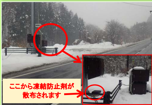
ここから凍結防止剤が 散布されます