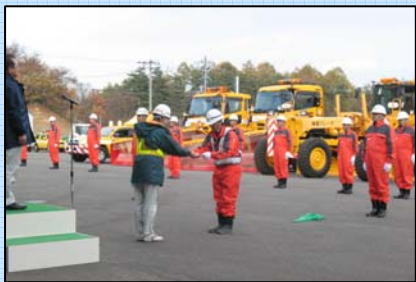
出張所長から現場代理人へ鍵の引き渡し

オペレーター代表による安全宣言が行われた後、除雪機械の鍵が二戸国道維持出張所長から現場代理人へ、現場代理人からオペレーターの手へ渡ると、各除雪機械のエンジンが一斉に始動。ランプの球切れはないか、除雪装置が正常に動くか一台一台機械の状態を確認し、いつでも除雪作業に対応できるよう万全の体制に入りました。