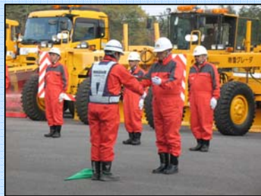
現場代理人からオペレーターへ鍵の引き渡し