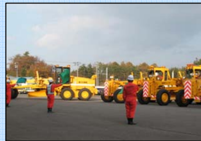
号令「エンジン始動！」