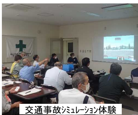
交通事故シミュレーション体験