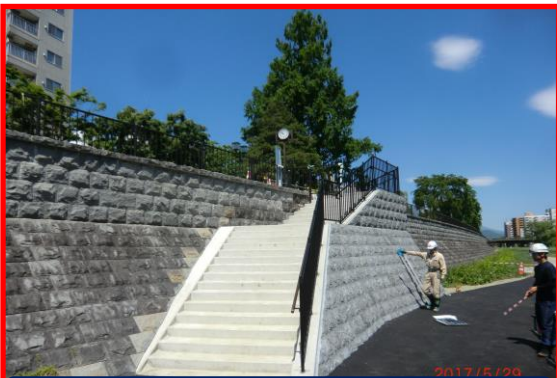
①盛岡駅前通り工区 階段完成間近