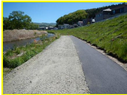
②加賀野工区 遊歩道と階段完成