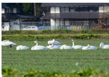
【R4.11.20 東雲橋付近(北上川)】