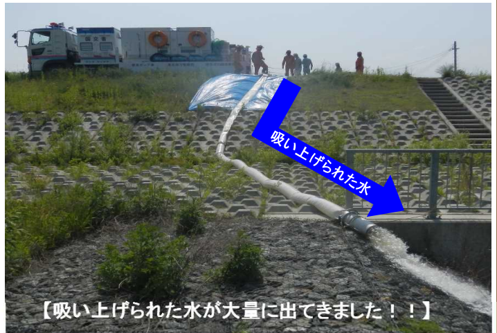
【吸い上げられた水が大量に出てきました！！】