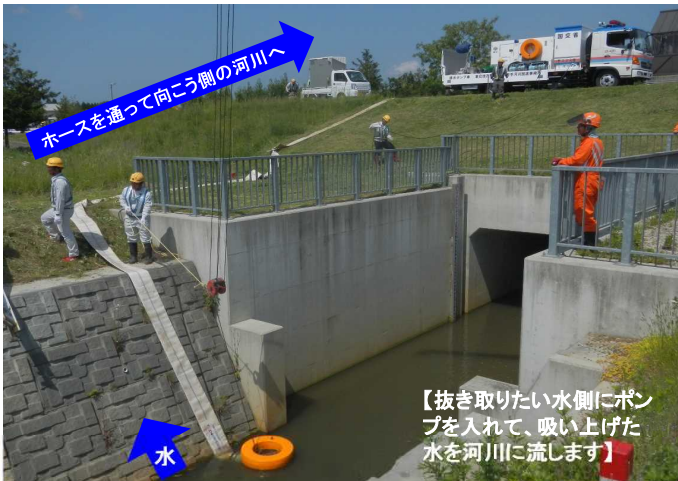
【抜き取りたい水側にポンプを入れて、吸い上げた水を河川に流します】