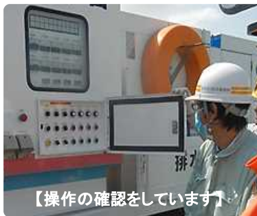
【操作の確認をしています】