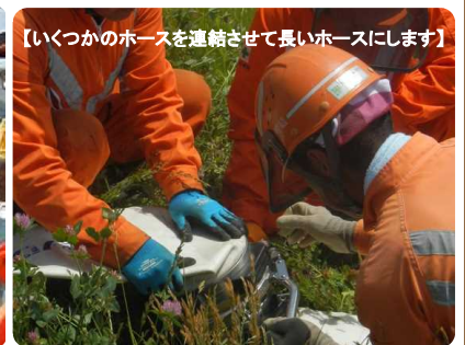
【いくつかのホースを連結させて長いホースにします】