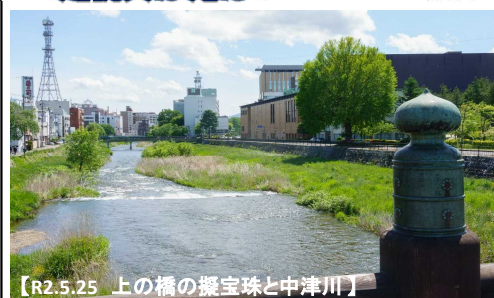
【R2.5.25 上の橋の擬宝珠と中津川】