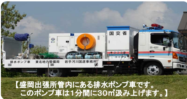
【盛岡出張所管内にある排水ポンプ車です。このポンプ車は1分間に30m 3 汲み上げます。】

当日は、排水ポンプ車の構造理解や手順の確認など、災害現場で臨機応変の対応ができるよう訓練しました。