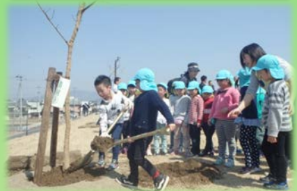
青葉地区の植樹祭の様子