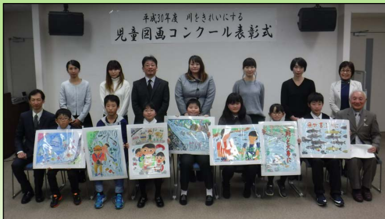
平成30年度 川をきれいにする 児童図画コンクール表彰式