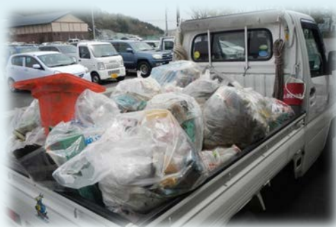
回収したゴミは軽トラック1台分に!!