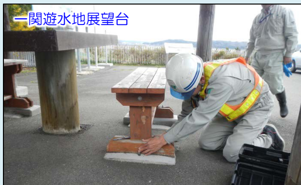
一関遊水地展望台