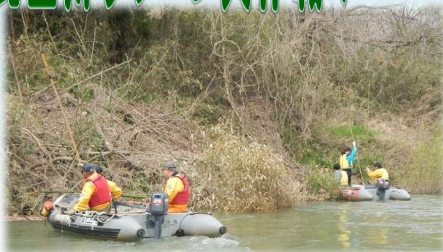
狭い場所のゴミはゴムボートが活躍!

4月22日(日)、「第29回 北上川クリーン大作戦!」が行われました。(川崎防災ステーションからユース探石場付近まで)42名の参加者が、河川調査船ゆはず・長生丸・ゴムボートの計7艇に乗り込み、木に巻き付いたビニールや川岸のゴミなどを拾い集めました。