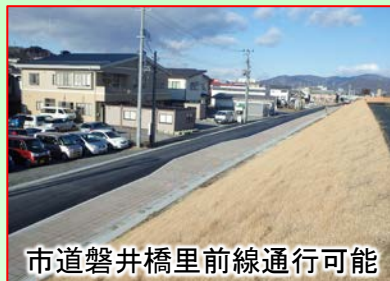
市道磐井橋里前線通行可能

これから3月中旬予定の新堤防完成まで近隣の皆様には、ご理解とご協力よろしくお願ひします。