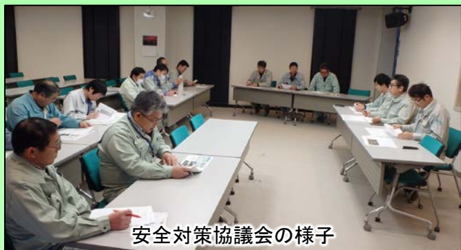
安全対策協議会の様子