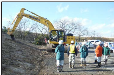
バックホウ法面整形

ICT建機によるバックホウ法面整形状況の施工とブルドーザー敷均しを間近で見てもらいました。車載されているモニターをコマツの「KomConnect」により大型モニターで確認。丁張りを無くした近未来のような工事施工の始まりです。