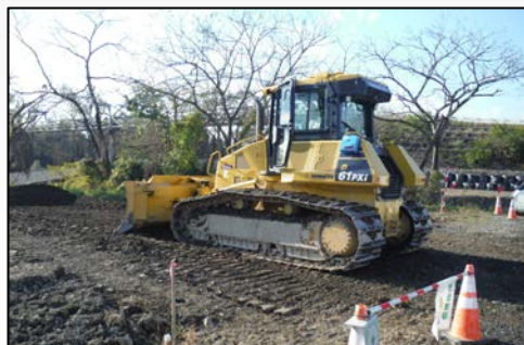
ブルドーザー敷均し