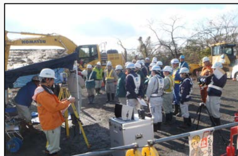
車載モニターを大型モニター確認

◆◆編集後記◆◆ 寒くなって温泉が恋しいシーズンですね(^_^) 私はバイキングや食べ放題がある温泉が大好きです！近場にも一関温泉郷があるので皆さんも行ってみたいはいかがでしょうか♪(す)