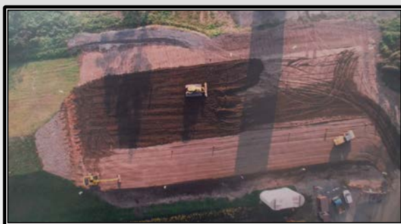
③マシンコントロールによる施工(ブルドーザー敷均しイメージ)