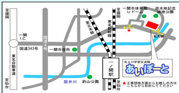
北上川学習交流館 あいぼーと位置図

この企画展は、日本全国で巡回展示を行っています。 「あいぼーと」では昨年6月に展示し、好評だったことか ら、梅雨の時期に合わせ、再度の展示を行うこととなり ました。興味のある方はぜひご来館下さい。