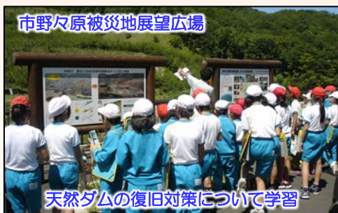
市野々原被災地展望広場