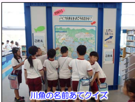
川魚の名前あてクイズ