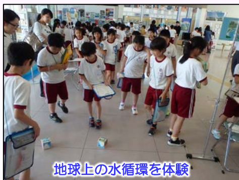
地球上の水循環を体験

平成28年6月10日（金）には、一関市立山目小学校4年生97名が訪れ、一関地区の水害、遊水地の役割について学びました。また、生徒らが水の分子となってサイコロを転がし、地球上の水循環を体験するゲームも行い水に対する理解を深めてもらいました。