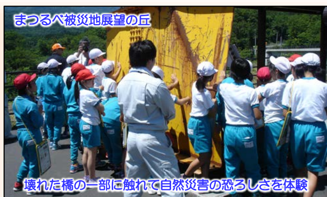
まつりべ被災地展望の丘