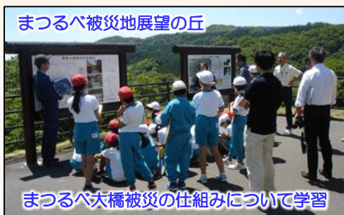
まつりべ被災地展望の丘