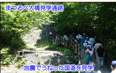
まつりべ大橋見学通路

平成28年6月10日（金）に、一関市立滝沢小学校の出前講座『磐井川砂防探検』が行われました。これは平成20年6月14日に発生した岩手・宮城内陸地震を契機に、一関地域における自然災害の恐ろしさや地域の安全を守る砂防施設などについて学習してもらうことを目的に行いました。児童らは、地震直後の話や天然ダム災害に対する応急対策の説明など熱心に聞いていました。