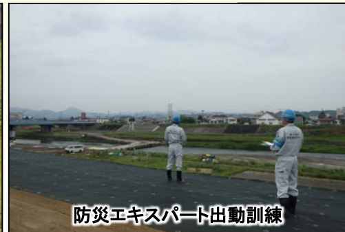
防災エキスパート出動訓練