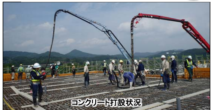
コンクリート打設状況