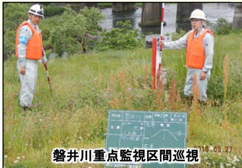
磐井川重点監視区間巡視