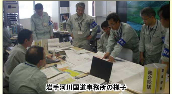
岩手河川国道事務所の様子