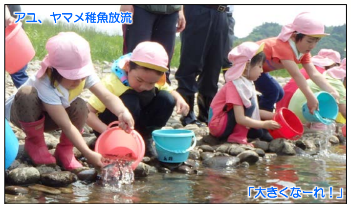
アユ、ヤマメ稚魚放流

一関水辺プラザでは、一関市立一関あおば保育園の園児と一般参加者、関係者合わせて約60名で「大きくなーれ！」のかけ声で、アユ約1万800尾、ヤマメ約4200尾を放流。3箇所の放流場所を合わせると約1万6000尾が放流されました。