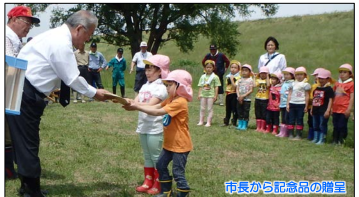
市長から記念品の贈呈

◆◆編集後記◆◆ 先日、家の中につばめが二度も入って来ました！つばめが家の中に入るのはいいことらしい(?)ので、いいことがありますように願っているこの頃です(^^) (す)