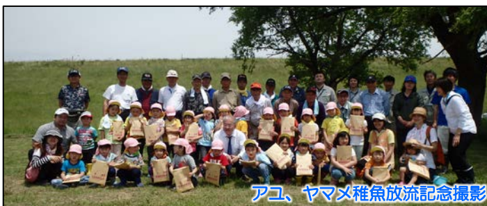
アユ、ヤマメ稚魚放流記念撮影