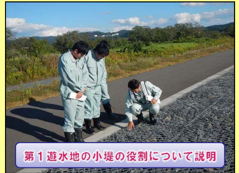
第1遊水地の小堤の役割について説明