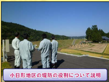
小日形地区の堤防の役割について説明