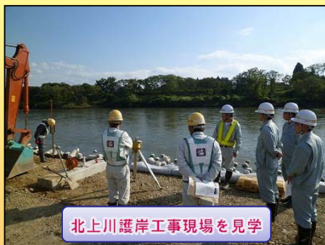
北上川護岸工事現場を見学