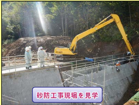
砂防工事現場を見学