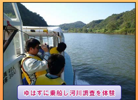
ゆはずに乗船し河川調査を体験

◆◆編集後記◆◆今回のあいらぽーとで、『200号』を迎えました。これからも一関出張所管内の工事情報やイベントなど伝えていきますのでよろしくお願ひします。(よ)