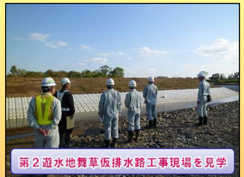
第2遊水地舞草仮排水路工事現場を見学