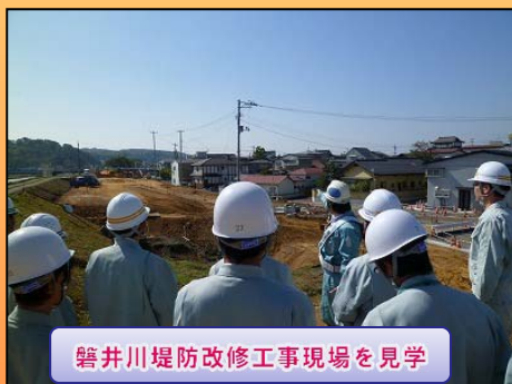
磐井川堤防改修工事現場を見学