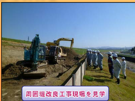
周囲堤改良工事現場を見学