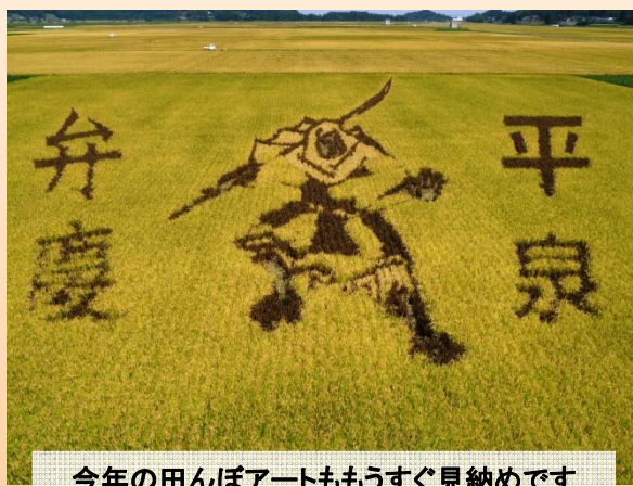
今年の田んぼアートもうすぐ見納めです

◆◆編集後記◆◆ 朝晩めっきり寒くなり、鍋物が美味しい季節になりました。みなさんはどんな鍋物が好きですか(^_^) 身も心もあたたかくして、みんなで元気に日々過ごしてまいりましょう！(Y)