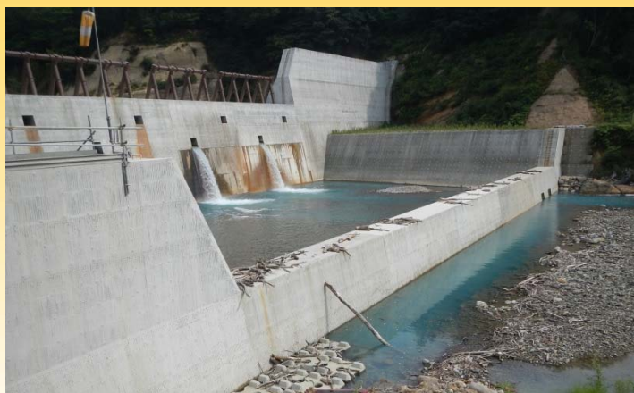
ほぼ完成した「槻木平砂防堰堤」9月19日撮影

現在、3箇所の砂防堰堤のうち2箇所が完成、最後の砂防堰堤である「槻木平砂防堰堤」についてもほぼ工事を完了しつつあります。工事が順調に進めば10月中には砂防堰堤が完成する見込みです。