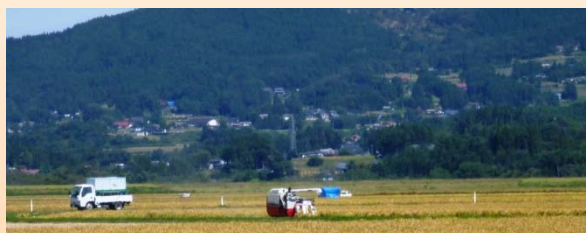
第一遊水地での稲刈りの様子

今年も一関遊水地内の田んぼの稲刈りが先週頃から始まっています。今年は今のところ大きな洪水もなく、遊水地内に湛水するような被害もなかったことから、無事実りある秋を迎えています。これから稲刈りも最盛期を迎えますが、無事収穫を終え、早く遊水地で獲れたおいしい新米が食べられることを期待しています！農家の皆さんも農機具の事故等には気をつけて作業をしていただければと思います。