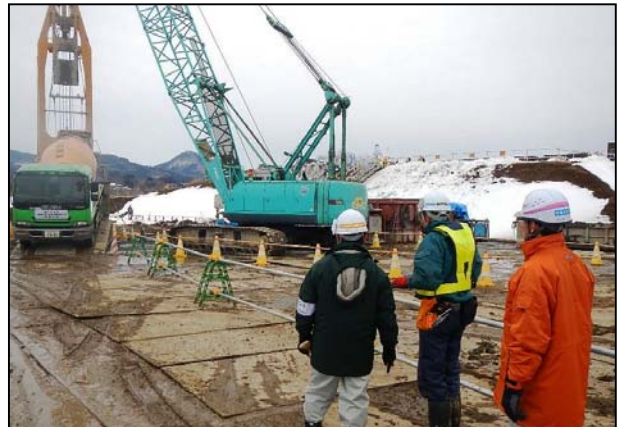
一関遊水地大林排水施設躯体工事現場パトロール