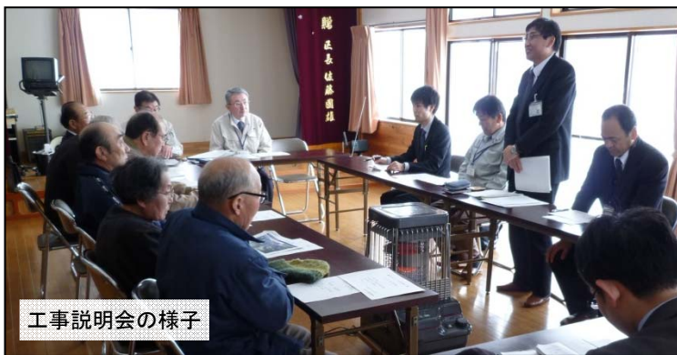
工事説明会の様子

2月6日(木)に、観音山CCTV設置工事説明会を一関市舞草コミュニティセンターで行いました。