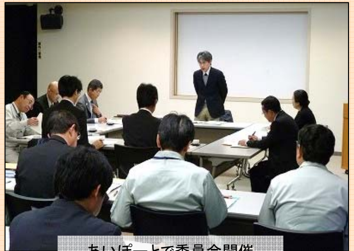
あいぽーとで委員会開催