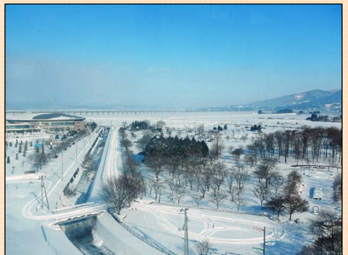
あいぽーとから見た一関遊水地記念公園

これから雪が溶け、早朝や夜に気温が下がると路面が凍結して滑りやすくなります。車の運転や歩道歩く際にはスリップや転倒に十分気をつけて下さい。