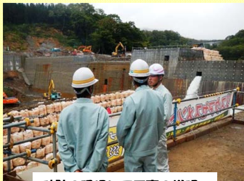
砂防の現場にて工事の説明