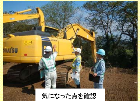
気になった点を確認

今回は一関遊水地の2工事を対象として、2班に分かれて現場を点検した後、出張所にて点検結果の検討会を行いました。