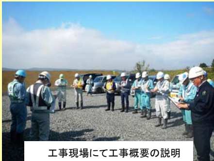
工事現場にて工事概要の説明

安全パトロールとは、普段から工事で事故が発生しないように安全に努めて施工していますが、さらに安全に工事を進めるため、発注者である岩手河川国道事務所と管内各工事の安全管理担当者の合同で当出張所の工事現場及び現場事務所を点検し、良かった点や改善すべき点を検討することで、今後の各工事においても活かしていくために毎年度回数実施しています。