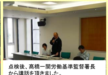
点検後、高橋一関労働基準監督署長から講話を頂きました。