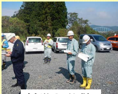
安全パトロールに参加