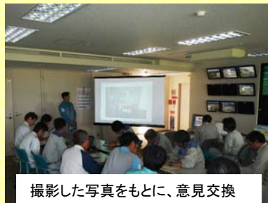
撮影した写真をもとに、意見交換

今回の安全パトロールにて発見された改善点等を今後の工事に活かし、安全に工事を進めていきたいと思えます。