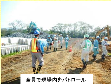
全員で現場内をパトロール