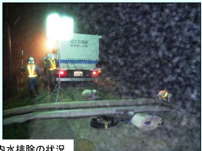
排水ポンプ車による内水排除の状況