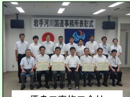
優良工事施工会社