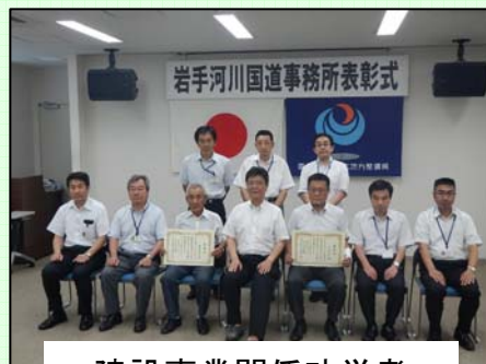
建設事業関係功労者