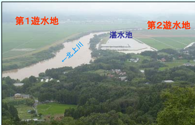
観音山より一関遊水地撮影

出張所では、北上川や支川の水位上昇による水害を防ぐために樋門の操作や前堀・平泉の排水機場のポンプを稼働させて堤内地への浸水を防ぐとともに、管内の巡視を行い堤防等の河川管理施設の状況把握を行いました。なお、点検の結果異常は認められませんでした。