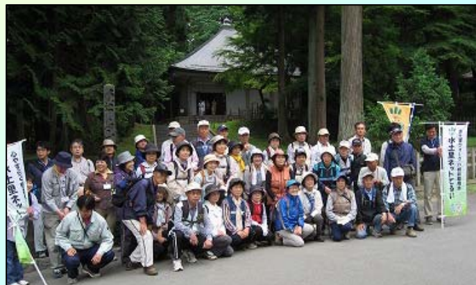
中尊寺にて集合写真

6月28日(金)、“水土里ウォークin照井堰用水”が、「あいぽーと」・「水土里ネットるい」などの共同で開催されました。参加者約57名は、照井堰用水沿いに設置されているウォーキングトレイルを毛越寺や平泉文化遺産センター、中尊寺などを経由しながら約8kmのコースを歩きました。