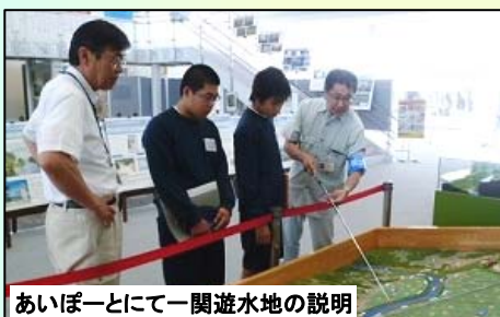
あいぽーとにて一関遊水地の説明