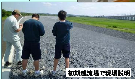
初期越流堤で現場説明