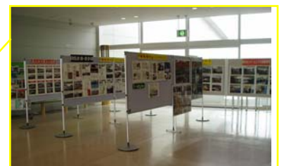
エントランスの展示コーナーでは様々な企画展示を行っています。