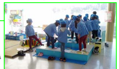
川にあってはいけない物は何かな? 環境も学べる釣りゲームもあります。