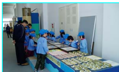
川に棲む魚や昆虫の標本があり、川の自然を学習できるコーナー。