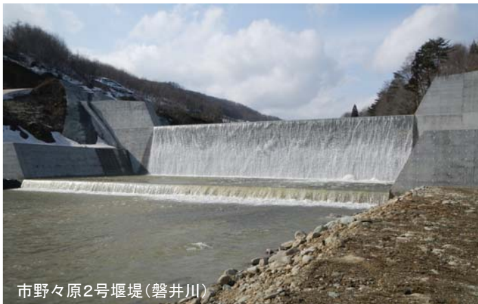
市野々原2号堰堤(磐井川)