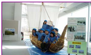
子供たちに人気のナイル川のよし舟。 100人乗っても大丈夫!

北上川学習交流館「あいぽーと」は、館内の配置をわかりやすくするため、展示物等をテーマごとにまとめて再配置しました。一関遊水地をはじめとした治水事業に関するもののほか、北上川と平泉文化との歴史的な関わり、洪水や砂防などの防災、川の自然環境を学べるものを展示しています。お子様から大人まで、楽しみながら学習することができますので是非ご来館ください!!