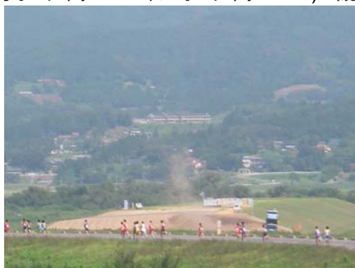
↑ 周囲堤を走る各校の選手達。レース中は安全のため工事を中断し、大会に協力しました。