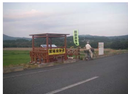
↑ ジョギングに疲れたら安全協議会で設置した東屋で休憩をどうぞ♪