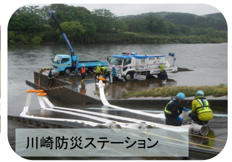
川崎防災ステーション