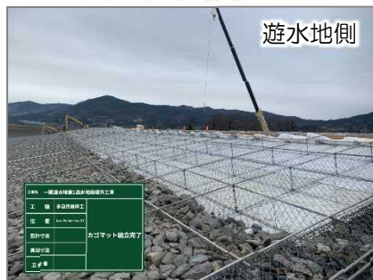
カゴマット設置状況