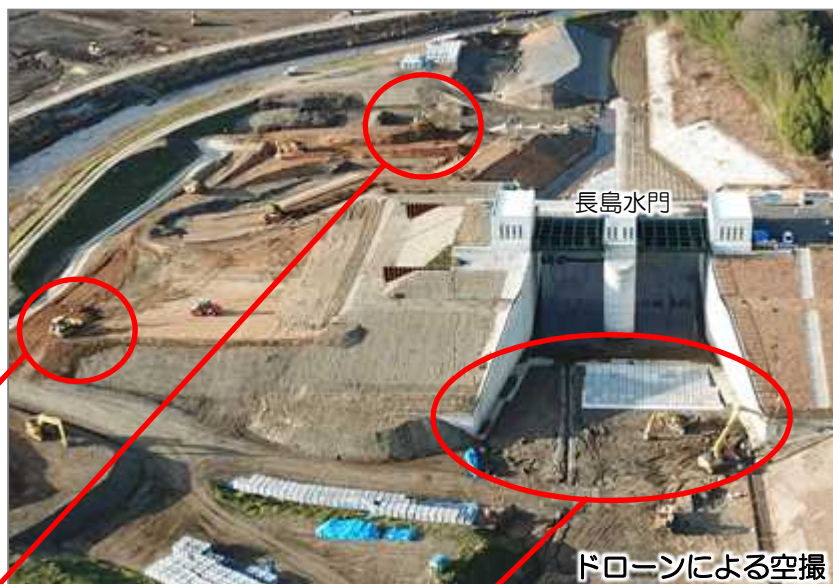
ドローンによる空撮