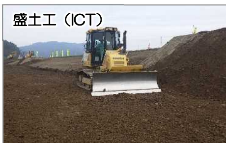
盛土工 (ICT) 盛土材敷均し