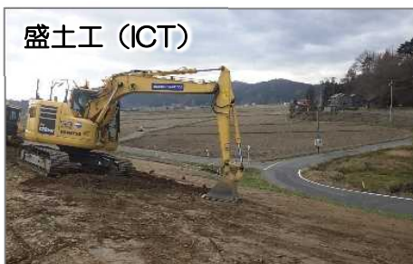
盛土工 (ICT) 法面整形