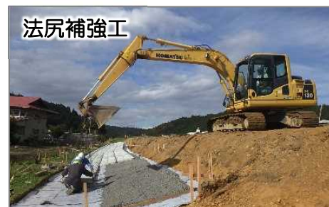
法尻補強工 張ブロック施工状況