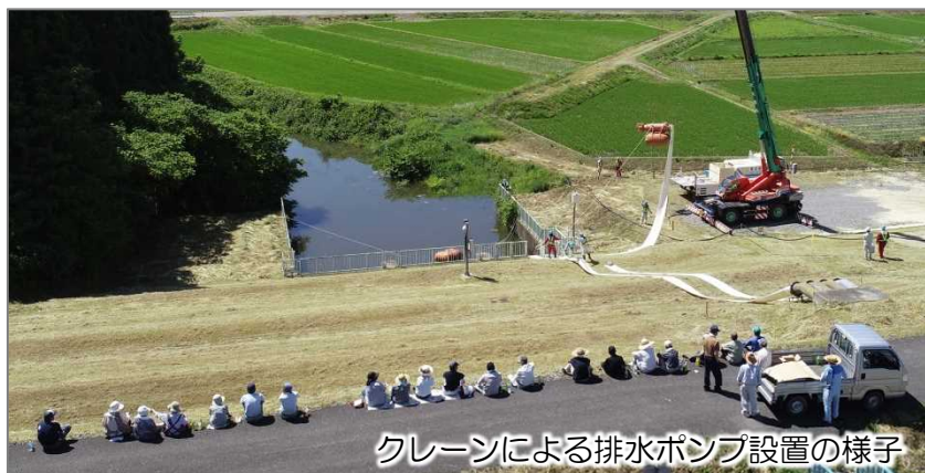
クレーンによる排水ポンプ設置の様子