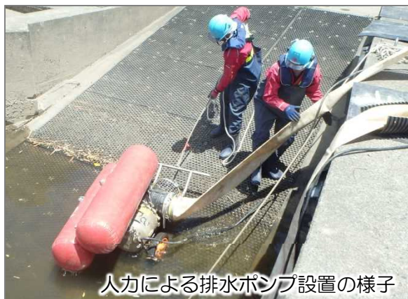
人力による排水ポンプ設置の様子

■訓練場所：北上川 川崎地区河川防災ステーション（ポンプ車規格30m 3 /min）