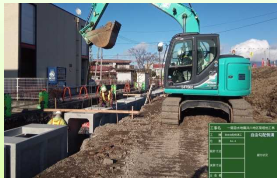
写真② 自由勾配側溝