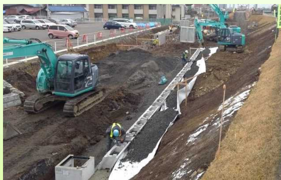
写真① コンクリートブロック積