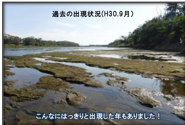
過去の出現状況(H30.9月)