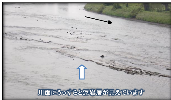
川面にうっすらと泥岩層が見えています