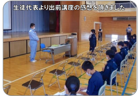
生徒代表より出前講座の感想を頂きました