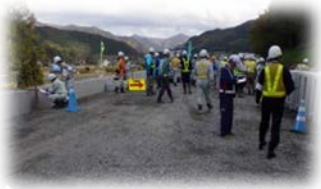
パトロール実施中