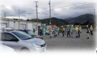
現場事務所を点検