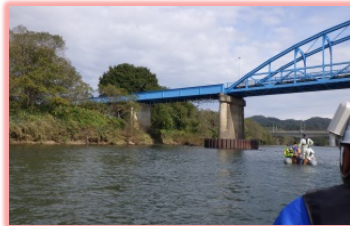
■橋梁下部を通過中

10月16日(火)と17日(水)の二日間、花巻市から奥州市にかけて北上川の管理区間をゴムボート二艇により川面を下りながら、巡視を行いました。