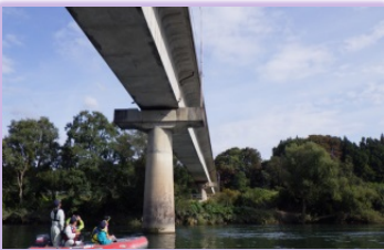
■橋脚に近づいて点検