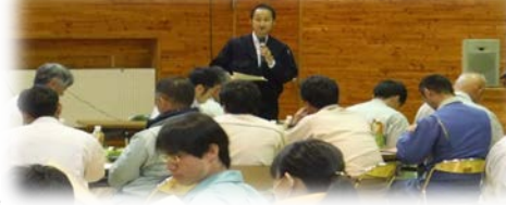
釜石労働基準監督署『安全講話』