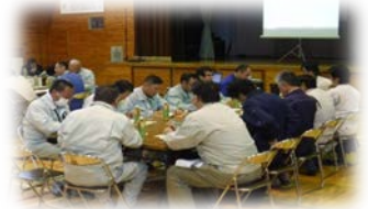
4班での討議・検討

点検後の安全検討会では、班毎に安全対策の好事例や改善すべき事項などについて、討議・検討し、意見交換を行いました。また、安全講習会として釜石労働基準監督署監督課長様から平成30年度の労働災害発生状況等の講話をいただき、今後も工事事務所事故防止に取り組むことを誓いました。