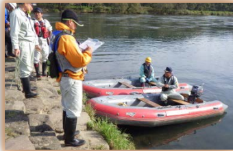
■二艇により巡視へ出発