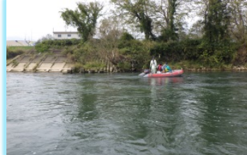
■護岸部へ接近して