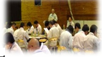
事業対策官による『講評』

◆紅葉の季節ですね♪アウトドアなどで河川敷を利用する際はごみは各自で持ち帰るなど、マナーを守って利用してくださいね(^^)