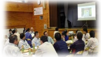
各班毎の討議結果発表