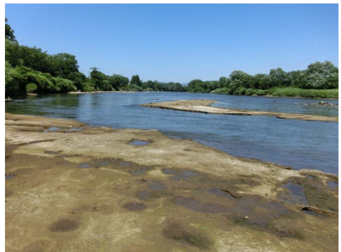
朝日橋水位観測所