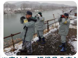
※寒い中、巡視員の方々が調査しました😊

◆ 今年は雪が少ないですね。でも安心して下さい...渡り鳥はたくさんいますよ。川へGO！(M)