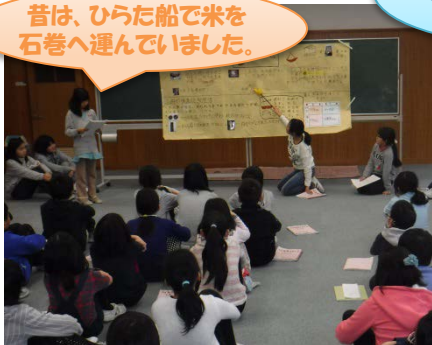
「北上川の舟運」成果発表