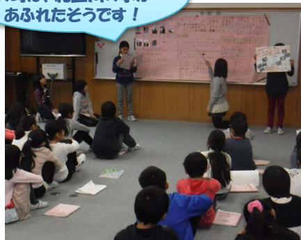
「カスリン・アイオン台風」成果発表