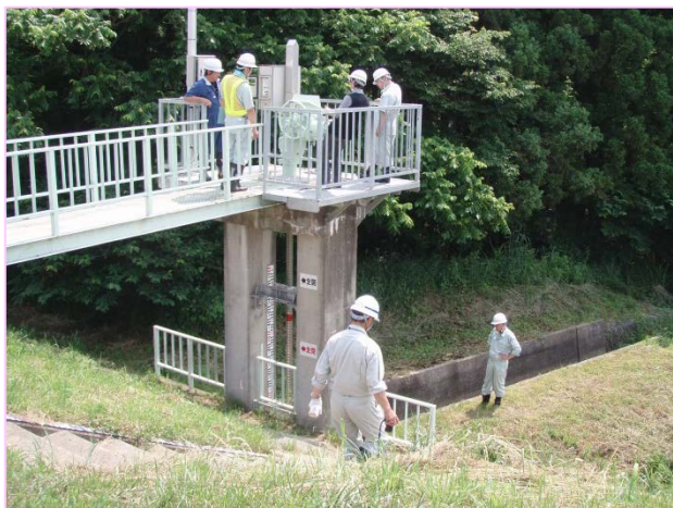
排水樋管の点検状況

点検は、6月15日～17日の3日間にわたり、出張所の職員と実際にゲート等の操作を行う水門等水位観測員が合同で実施し、ゲートの操作方法や動作等を確認しながら、出水時の注意事項など意見交換を行いました。