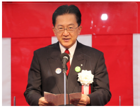
▲達増 拓也 岩手県知事 挨拶