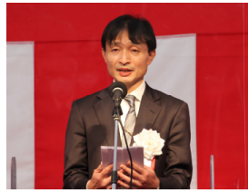
▲梅野 修一 国土交通省東北地方整備局長 挨拶