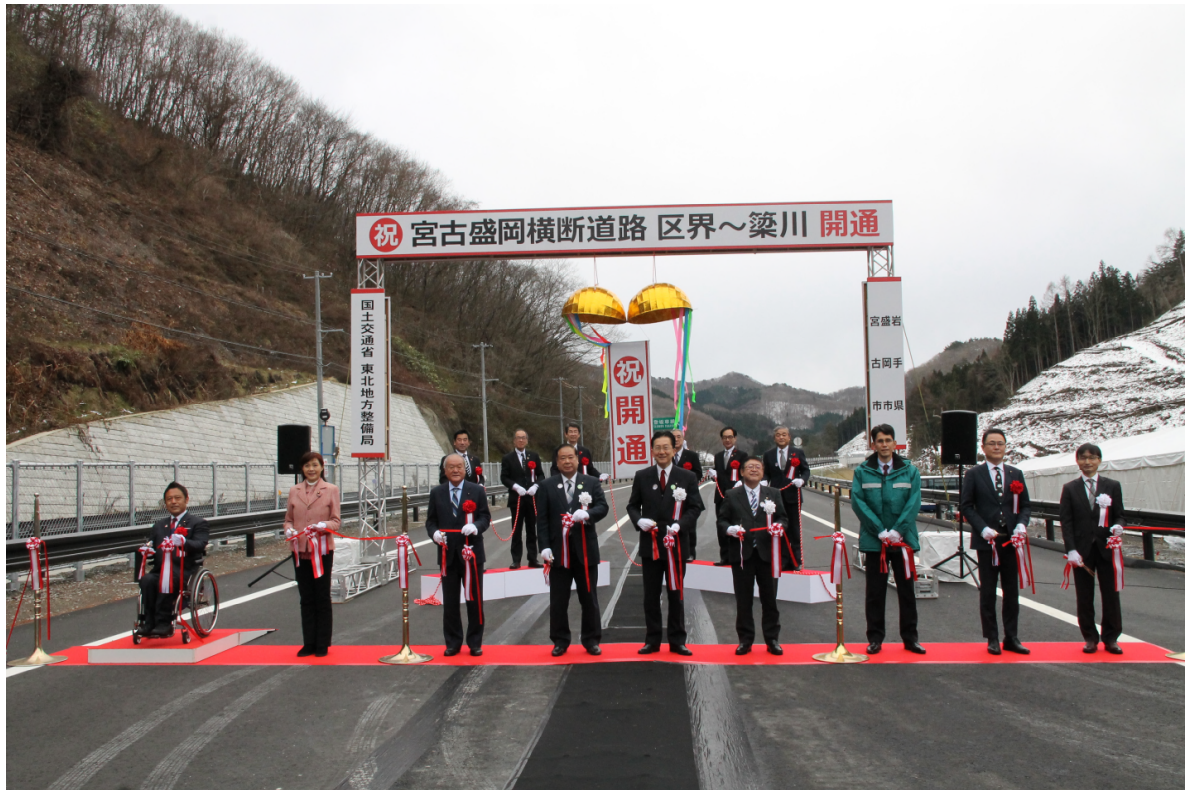
▲テープカット・くす玉開き