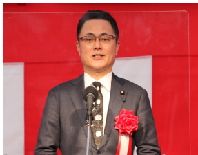
▲木戸口 英司 参議院議員 祝辞