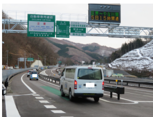
▲一般開放 (盛岡市側)