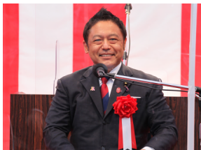
▲横澤 高徳 参議院議員 祝辞