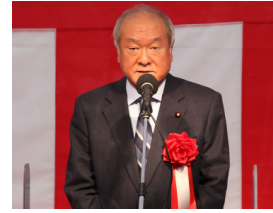
▲鈴木 俊一 衆議院議員 祝辞