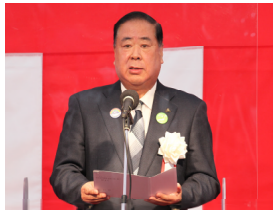
▲谷藤 裕明 盛岡市長 挨拶