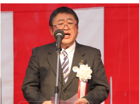
▲山本 正徳 宮古市長 お礼の言葉