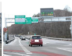
▲一般開放 (宮古市側)