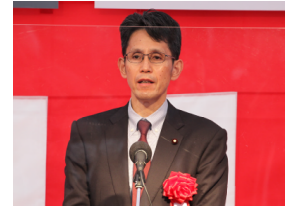
▲階 猛 衆議院議員 祝辞