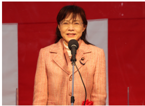
▲高橋 ひなこ 衆議院議員 祝辞