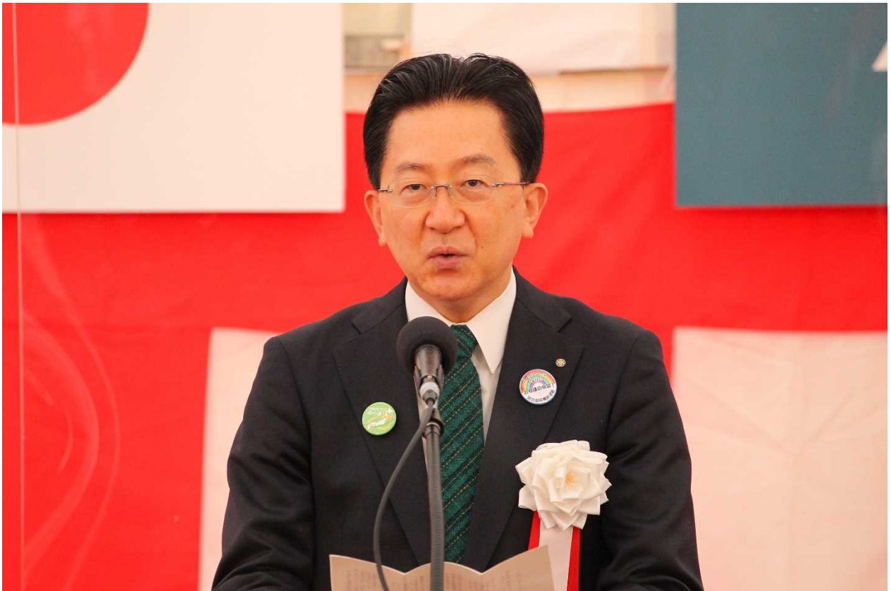
達増 拓也 岩手県知事 挨拶