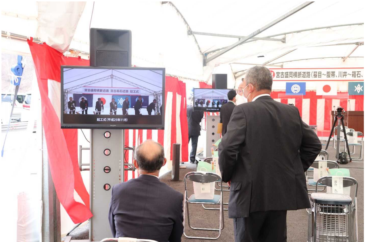
事業概要及び期待のメッセージ放映