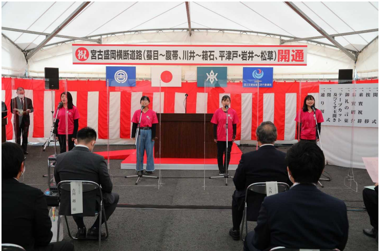
「拓け、いのちの道を」合唱