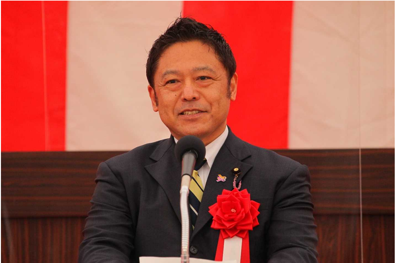
横沢 高德 参議院議員 祝辞