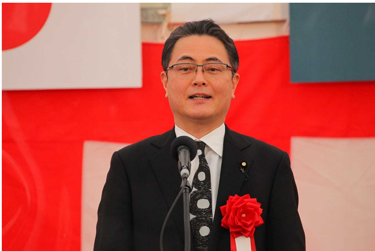
木戸口 英司 参議院議員 祝辞