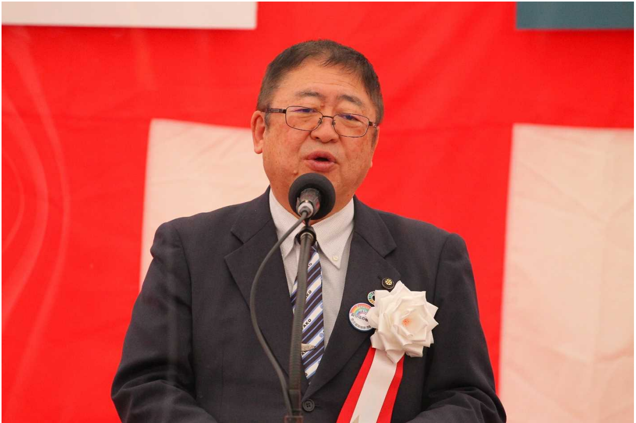
山本 正徳 宮古市長 挨拶