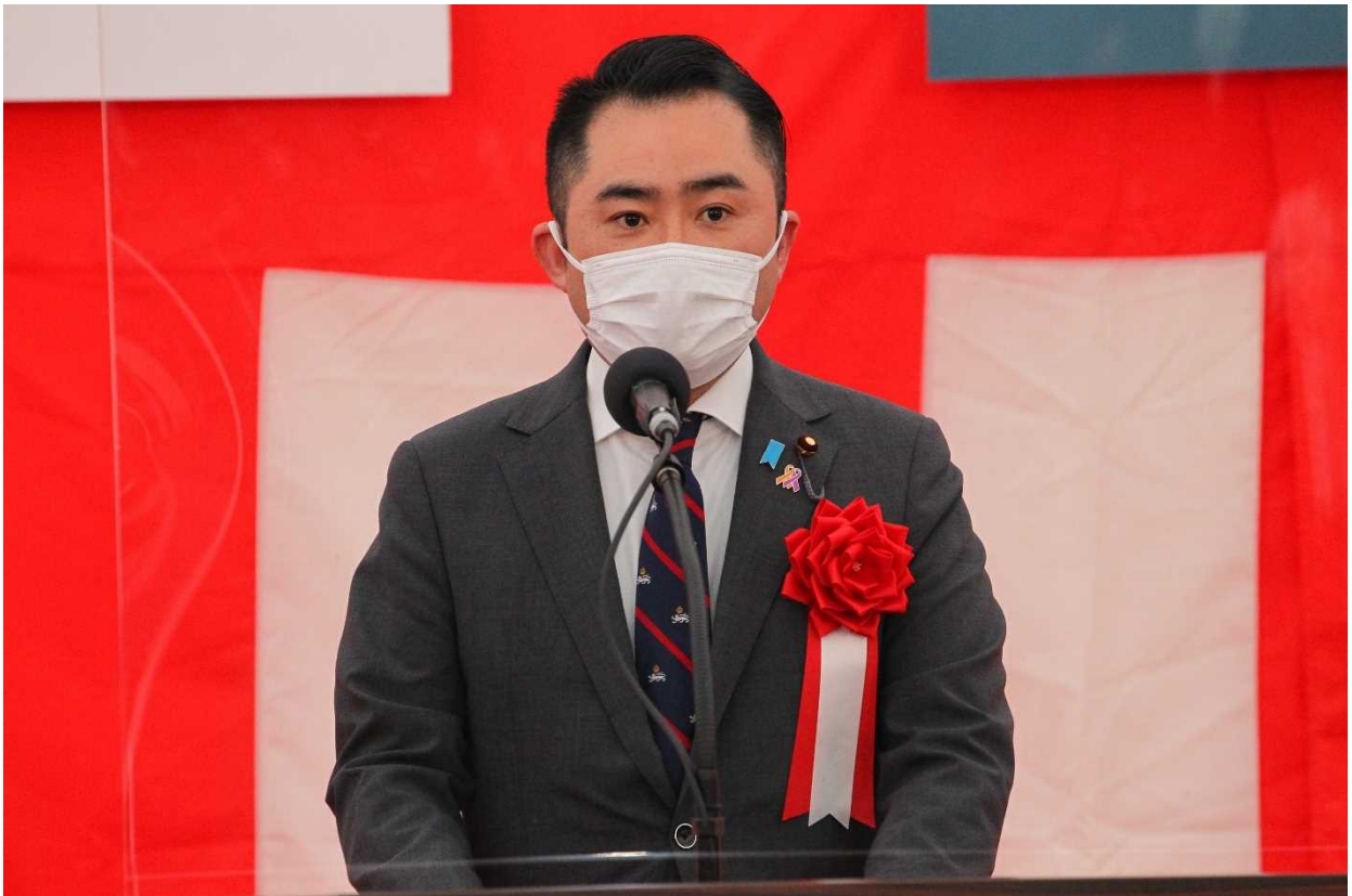
吉川 赳 復興大臣政務官 祝辞