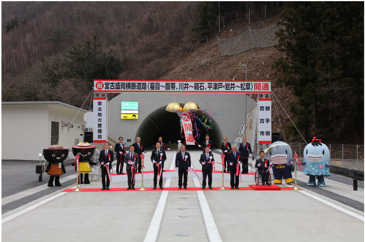
テープカット及びくす玉開き