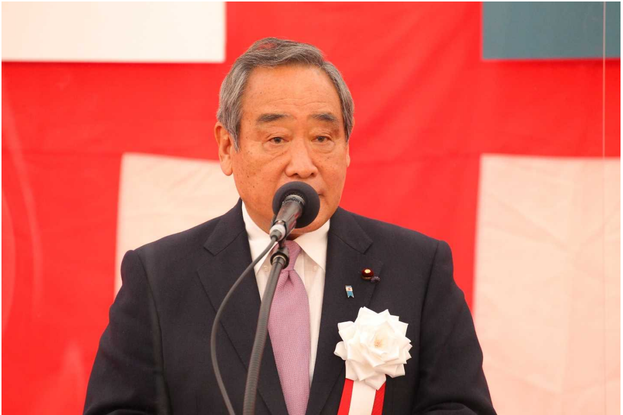
大西 英男 国土交通副大臣 挨拶