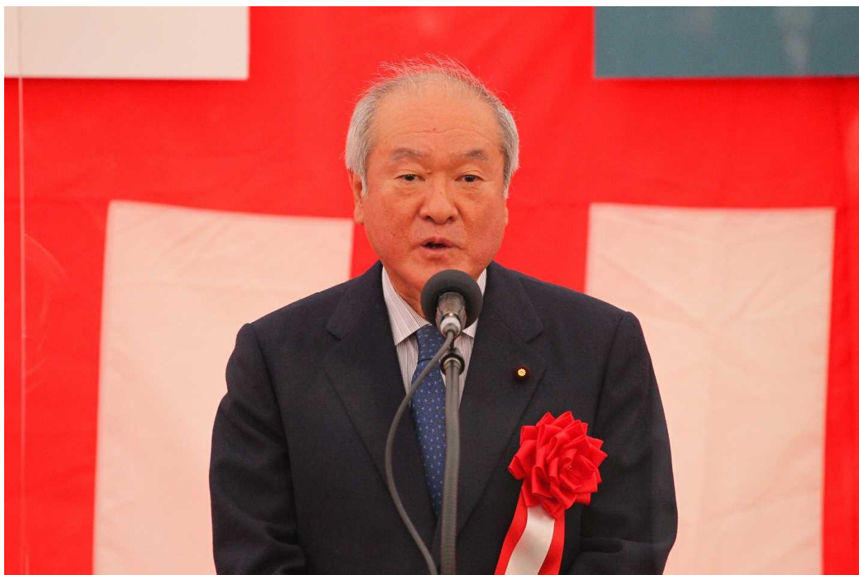
鈴木 俊一 衆議院議員 祝辞