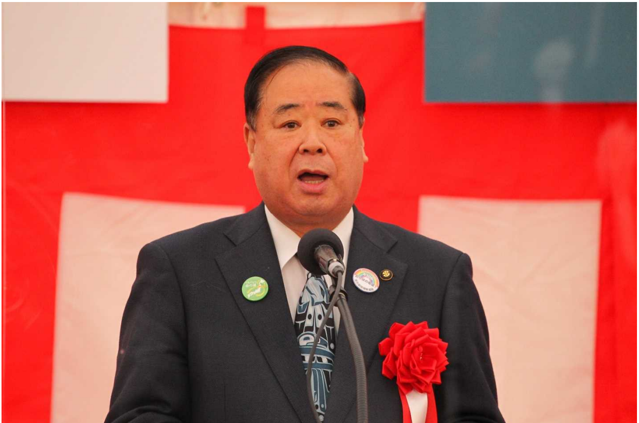
谷藤 裕明 盛岡市長 御礼の言葉