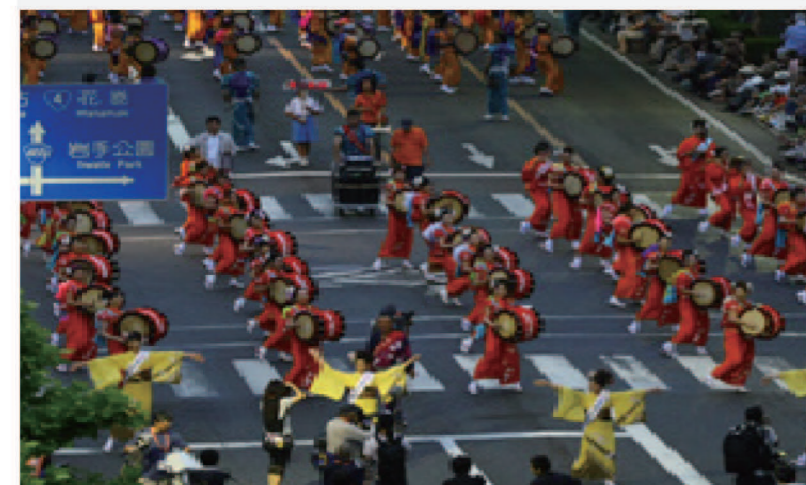
盛岡さんさ踊り (8月1~4日) 3

岩手の夏を代表する風物詩。世界一の太鼓パレードとも称される盛岡さんさ踊りは、「サッコラチョイワヤッセ」の掛け声と共に、笛や太鼓が打ち鳴らされる。本番前の夕刻には、町中から稽古の音が聞こえてくる。