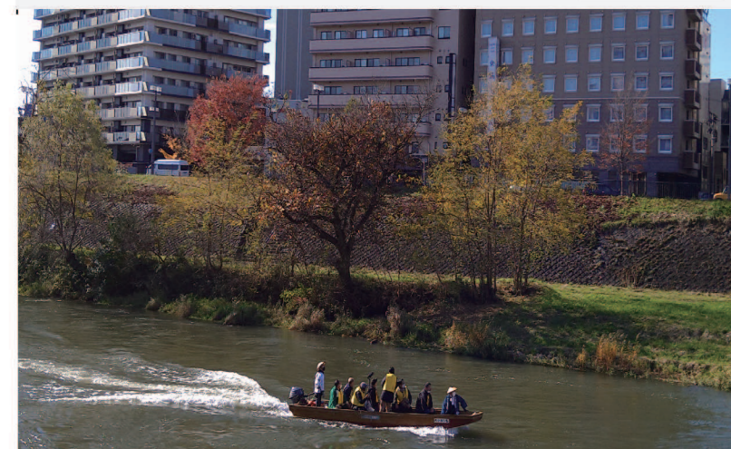
北上川の舟運 (5~10月) 2

奈良・平安時代にはじまった北上川の舟運は、伊達政宗の命によって石巻から盛岡までの200kmの舟運路が整備され、明治中期まで盛岡の重要な交通手段であった。盛岡の歴史は舟運と共にあり、新たな文化として盛岡にのみがえる。