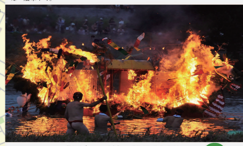
盛岡舟つこ流し (8月16日) 6

祖先の霊を送り、無病息災を祈るための送り盆の行事。提灯や供物、造花で飾り付けられた舟に火を放ち、明治橋上流から流され、橋を越えるころには燃え尽きる。みちのく盛岡の短い夏に別れを告げ、季節は秋へと移ろいゆく。