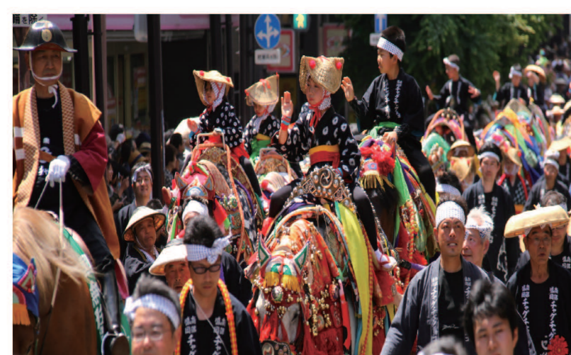
チャグチャグ馬コ (6月第2土曜日) 1

滝沢市の鬼越蒼前神社から盛岡八幡宮までの14キロの道のりを華やかな装飾とたくさんの鈴をつけた馬の行列が歩く。みちのくに初夏を告げる鈴の音は「残したい日本の音百選」にも選定されている。