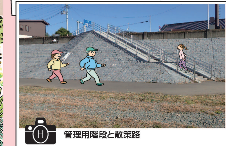
H 管理用階段と散策路