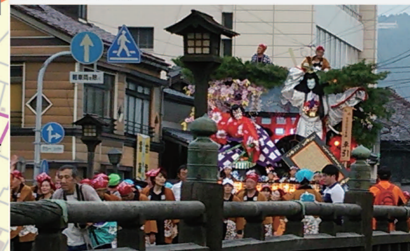
盛岡秋まつり・山車 (9月14~16日) 5

盛岡城下の誕生から300年以上の歴史を誇る、秋の伝統行事。祭り1か月前の夕刻には、本番に向けて練習している太鼓や笛の音が聞こえてくる。祭り期間中は、豪華絢爛な盛岡山車を引いた奉納組が市内を練り歩き、太鼓や笛の音と音頭上げで街中は一層華やぐ。