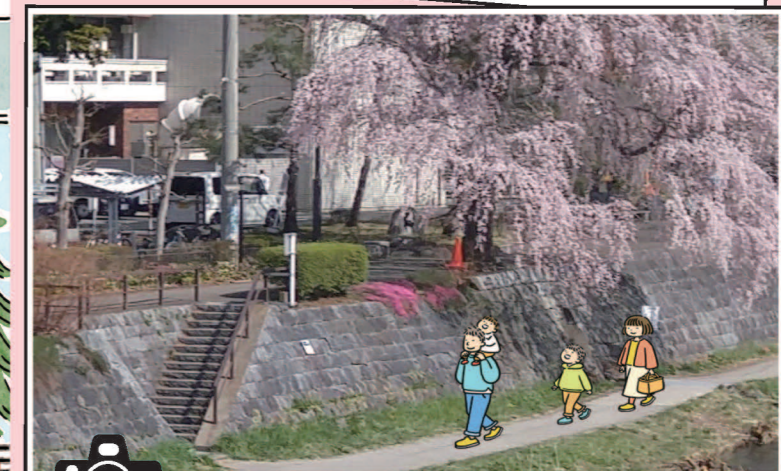
F 管理用階段と散策路