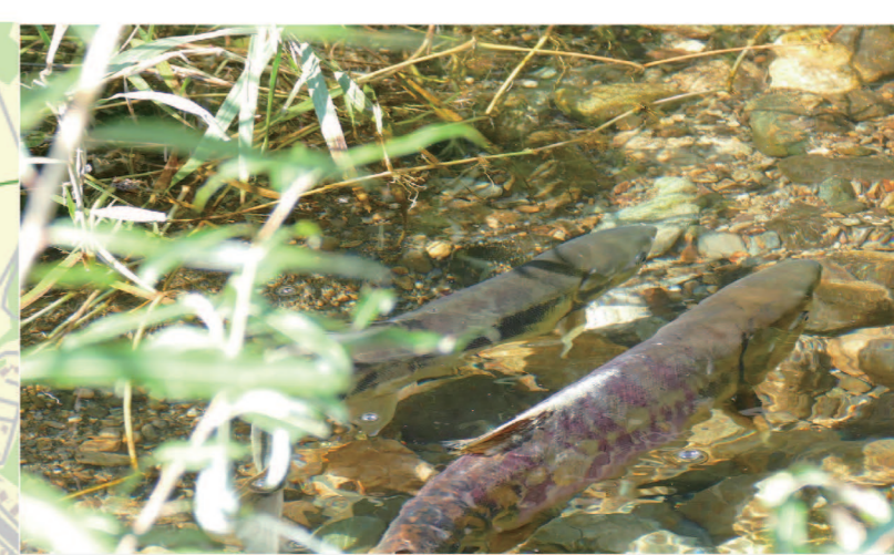
中津川の鮭の遡上 (9~1月) 4

生まれ故郷に戻ってきた、鮭は最後の力を振り絞り、川底に穴を掘って産卵を行う。翌春、卵から孵った鮭の子供は1000kmの旅へと出発し、大人になるとまた中津川へと戻ってくる。秋に聞こえる水しぶきから命の尊さが聞こえてくる。