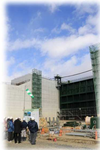
大林水門 見学状況