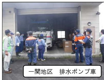
一関地区 排水ポンプ車