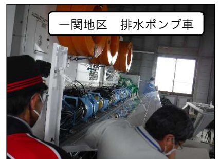
一関地区 排水ポンプ車