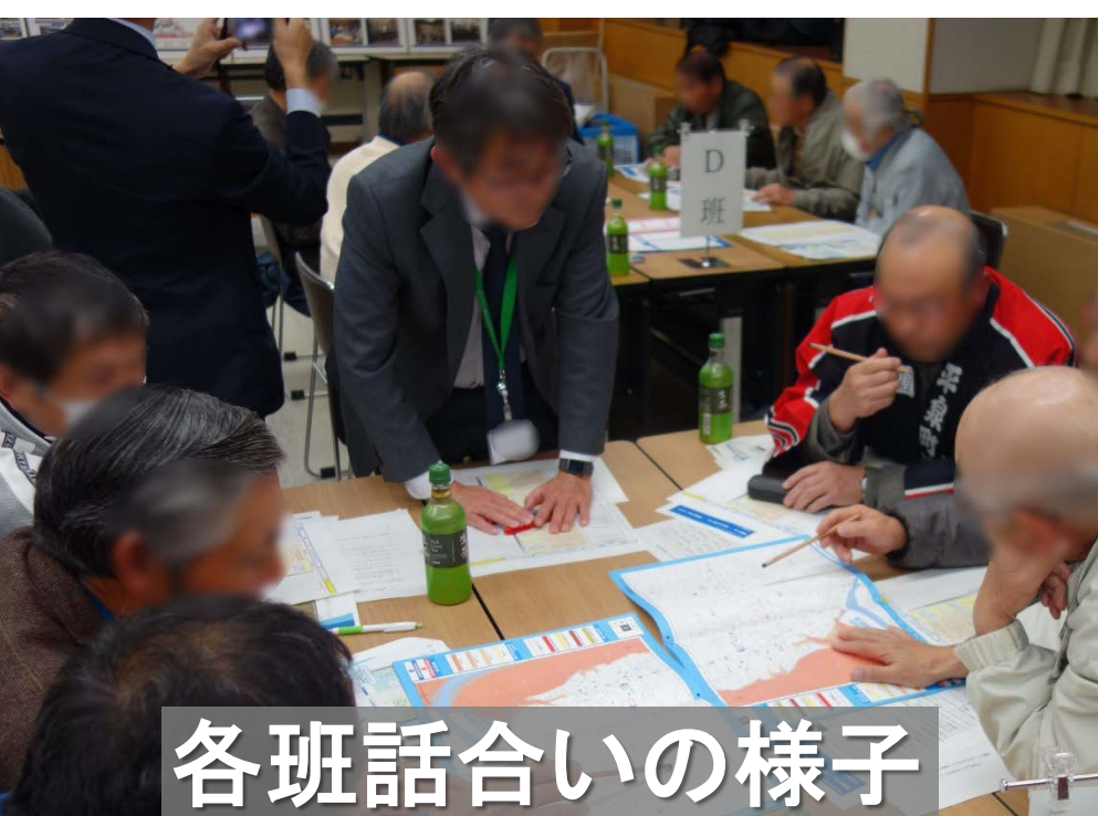
各班話し合いの様子