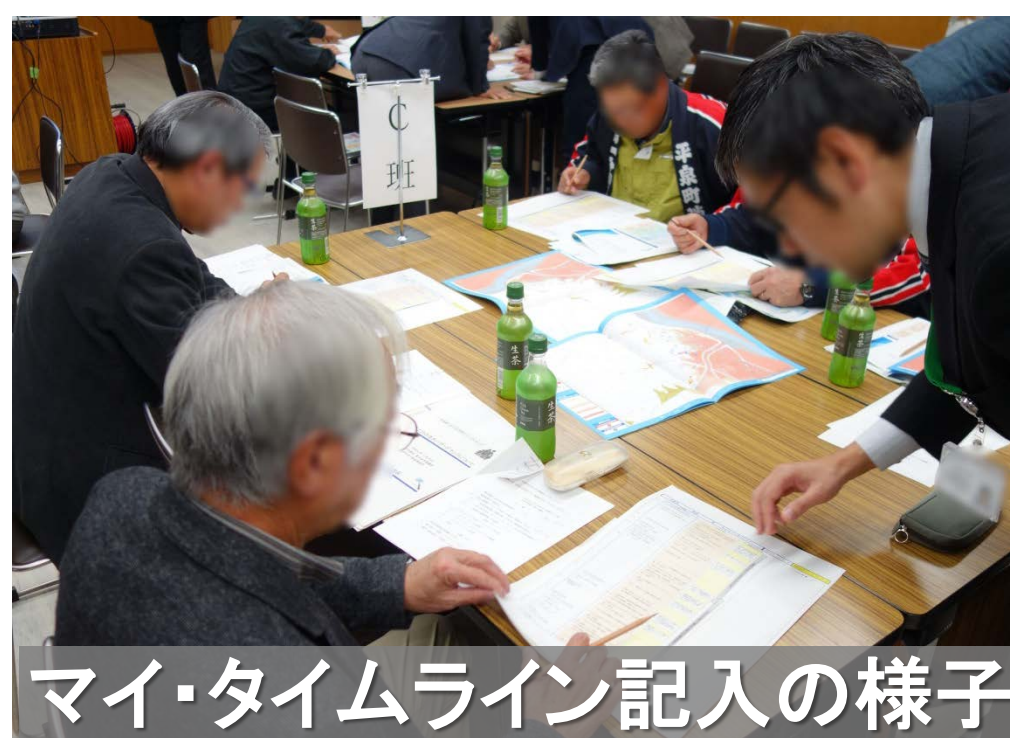
マイ・タイムライン記入の様子