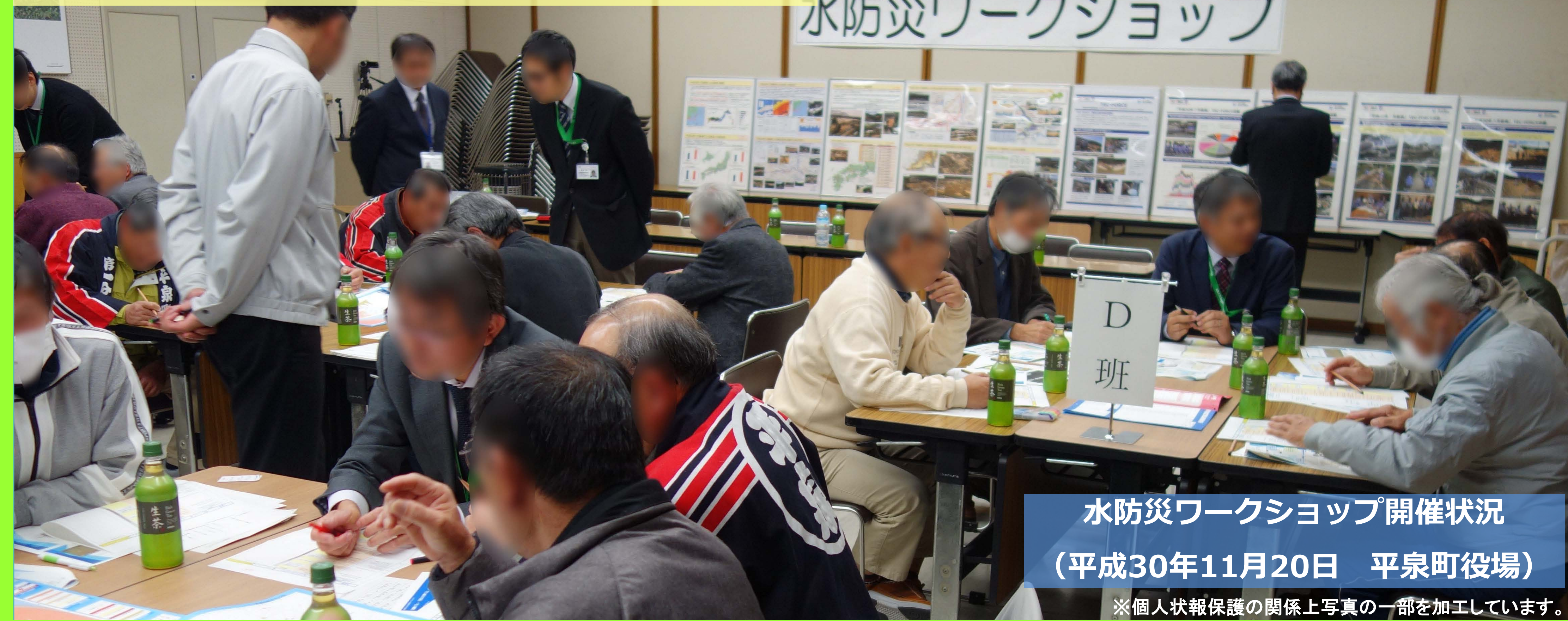
水防災ワークショップ開催状況 (平成30年11月20日 平泉町役場)