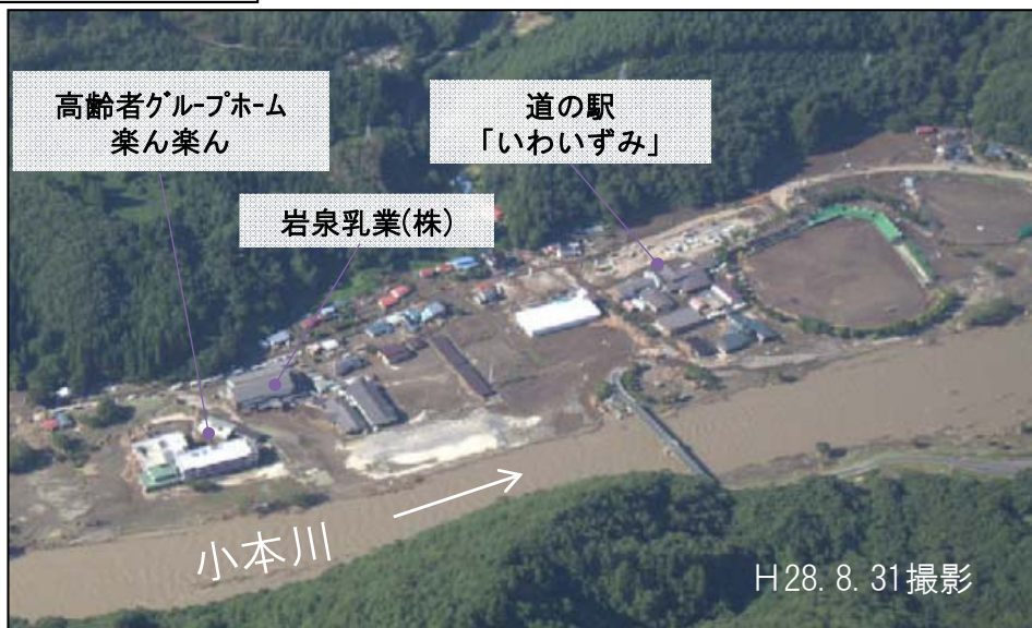
平成28年8月台風10号による小本川被災状況(岩手県岩泉町)