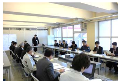
南会津方部水災害協議会(福島県)