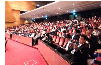
要配慮者利用施設説明会(青森市会場)