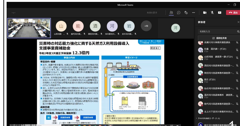
各施策の勉強会（各河川事務所の担当者も聴講）